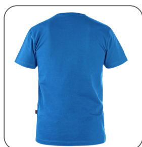
zadní strana back side z tyłu