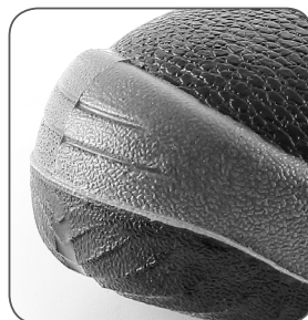
zesílená přední část proti okopu reinforced PU overcap nosek z PU wzmocnieniem