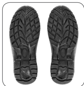
podešev outsole podeszwa