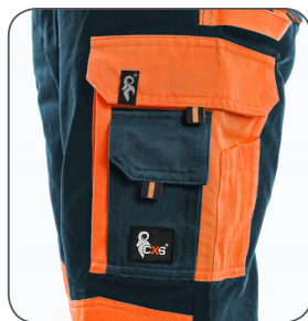
multifunkční kapsa multifunctional pocket wielofunkcyjna kieszeń