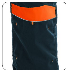
zdvojená kolena s možností vložení kolenních výztuh reinforced knees with possibility to insert knee pads podwójne kolana z możliwością włożenia nakolanników