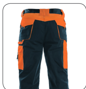
zadní strana back side odwrotna strona