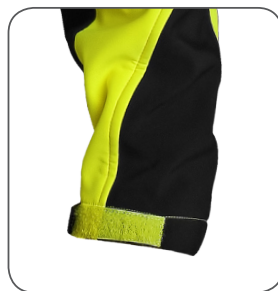
regulovatelná manžeta adjustable cuff regulowane mankiety