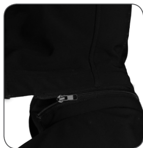
odepínatelná kapuce removable hood odejmowalny kaptur