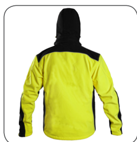
zadní strana back side odwrotna strona