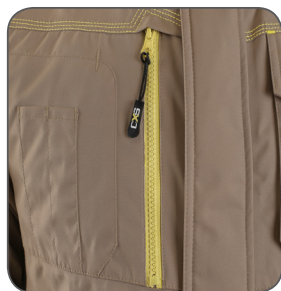
multifunkční kapsy multifunctional pockets wielofunkcyjne kieszenie