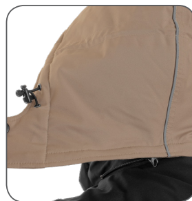
odepínatelná kapuce removable hood odejmowalny kaptur