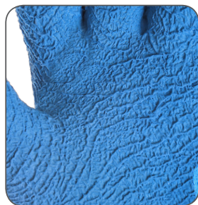
zdrsňný povrch crinkle finish szorstkie wykończenie