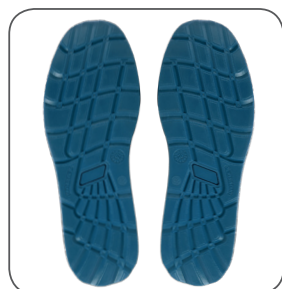
podešev outsole podeszwa