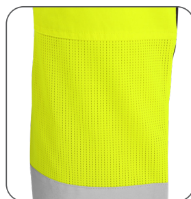
síťovina v zadní kolenní části mesh back knee part siatka z tyłu kolana