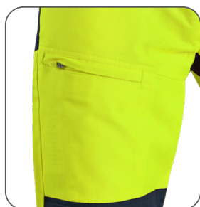
boční kapsa side pocket boczna kieszeń