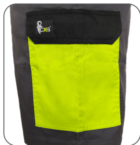
boční kapsa s klopou side flap pocket kieszeń boczna z patką