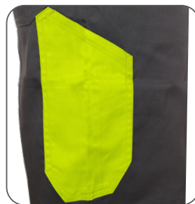
kapsa na skládací / svinovací metr tape / folding measure pocket kieszeń metr taśmowy / składany