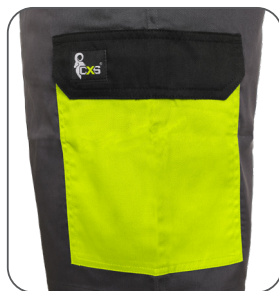
boční kapsa s klopou side flap pocket kieszeń boczna z patką