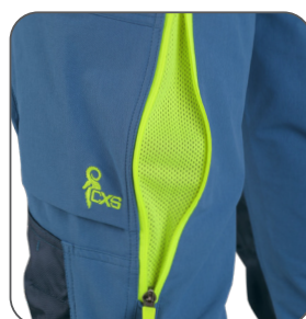
ventilace na stehně thigh ventilation wentylacja na nogawce