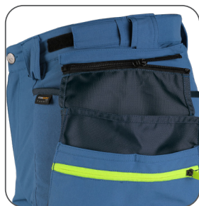
odepínací kapsy detachable pockets odpinane kieszenie