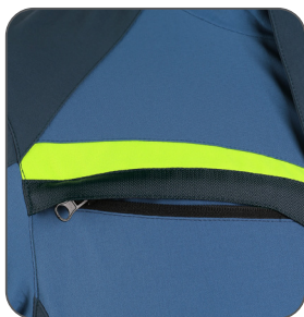
skrytá náprsní kapsa hidden chest pocket przykryta kieszeń na piersi