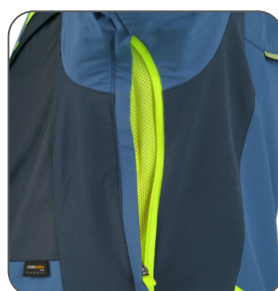
ventilace v podpaží underarm ventilation wentylacja pod pachami