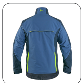
zadní strana - ventilace na zádech back side - ventilation wentylacja z tyłu