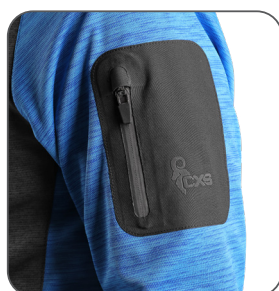
kapsa na rukávu pocket on the sleeve kieszeń na rękawie