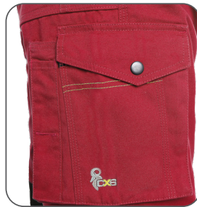
multifunkční kapsy na boku multifunctional side pockets boczne kieszenie wielofunkcyjne