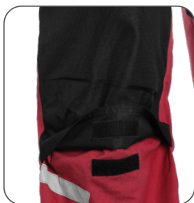
zesílena kolena s možností vložení výztuh reinforced knees with possibility to insert pads kolana wzmocnione z możliwością włożenia nakolanników