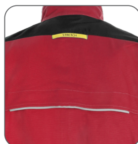
větrání na zádech ventilation on the back wentylacja z tyłu