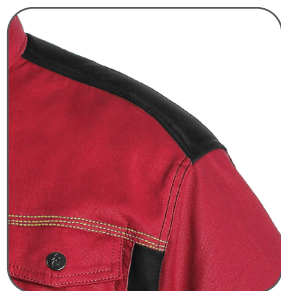
vyztužena ramena reinforced shoulders wzmocnione ramiona