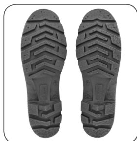
podešev outsole podeszwa