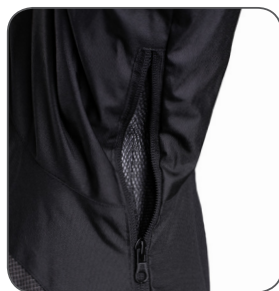
větrání v podpaží underarm ventilation przewietrzanie pod pachami