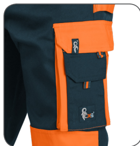
multifunkční vaková kapsa multifunctional sac pocket kieszeń wielofunkcyjna