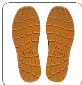
podešev outsole podeszwa