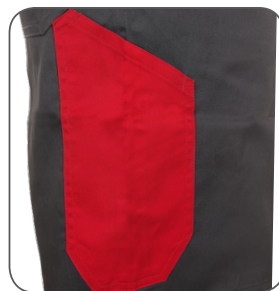
kapsa na skládací/svinovací metr tape/folding measure pocket kieszeń metr taśmowy / składany