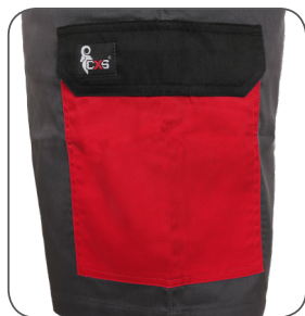
boční kapsa s klopou side flap pocket kieszeń boczna z patką