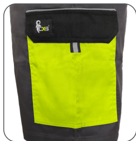
boční kapsa s klopou side flap pocket kieszeń boczna z patką