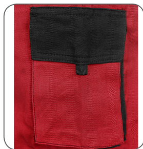
kapsa na mobil / peněženku pocket for mobile phone / wallet kieszeń na tel. kom. / portfel