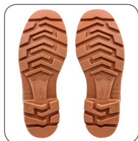
podešev outsole podeszwa