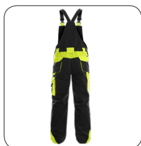
zadní strana back side z tyłu