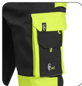
multifunkční vaková kapsa multifunctional sac pocket kieszeń wielofunkcyjna