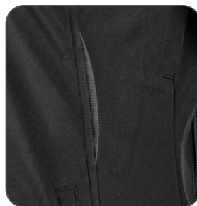
reflexní doplňky reflective accessories elementy odblaskowe