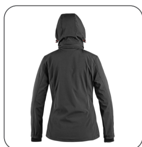
zadní strana back side z tyłu