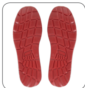
podešev outsole podeszwa