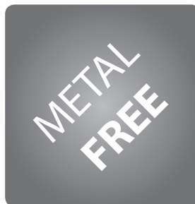
obuv bez kovových součástí metal free footwear obuwie bez elementów metalowych