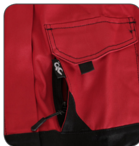
skrytá náprsní kapsa hidden chest pocket ukryta kieszeń na piersi