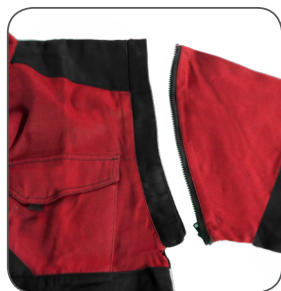
odepínatelné rukávy removable sleeves odpinane rękawy