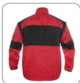
zadní strana back side z тылу