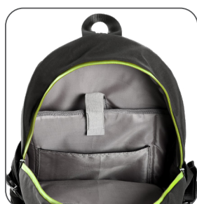
vnitřní kapsy inner pockets wewnętrzne kieszenie